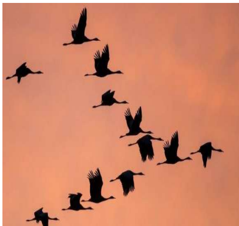
Migration des oiseaux

En hiver, les oiseaux migrateurs partent pour des pays plus chauds. Puis ils reviennent pour leur reproduction. C'est la migration !