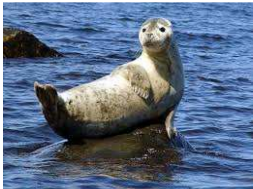
Phoque veau Marin en position banane