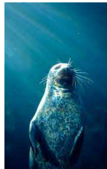
Phoque Gris en position bouteille

Lien: https://sites.google.com/site/luniversdesanimauxmarins/le-phoque-gris